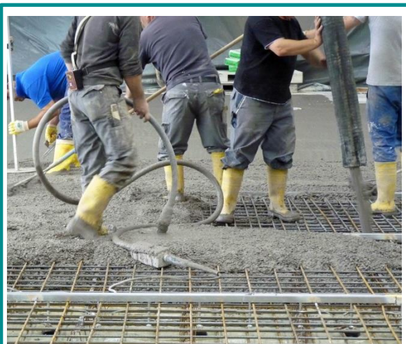
Konservierungsmittel in Betonzusatzmitteln können zur Freisetzung sehr geringer Mengen Formaldehyd führen

Für die routinemäßige Flächendesinfektion empfehlen die Hygieneverbände schon seit langem, formaldehydhaltige Reiniger nicht mehr zu verwenden, da vergleichbar wirksame Substitute verfügbar sind (z.B. peroxidhaltige Produkte, quaternäre Ammoniumverbindungen oder auch aldehydhaltige, aber formaldehydfreie Mittel).