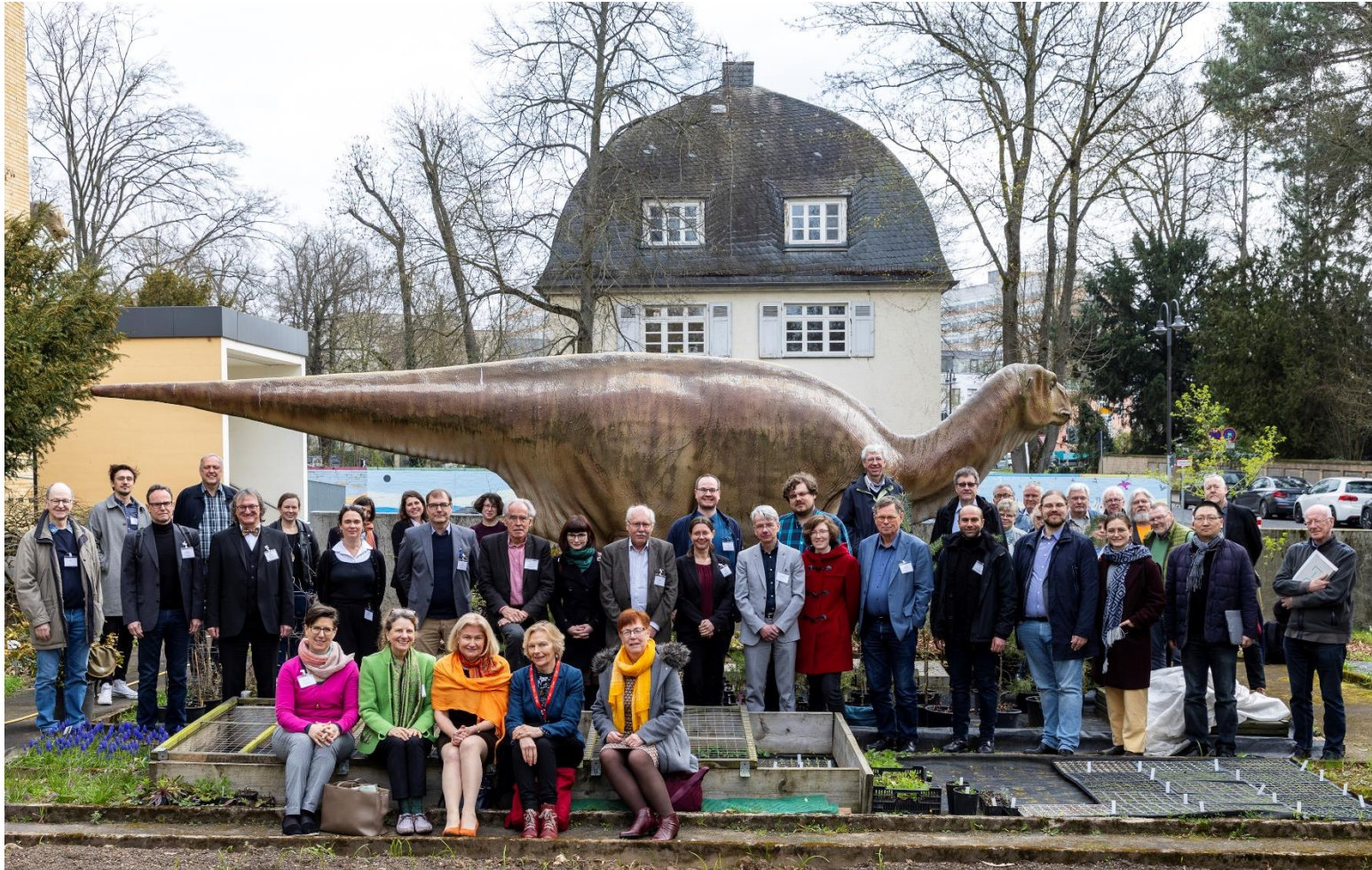
Teilnehmerinnen und Teilnehmer an der Tagung

21. und 22. März 2024 Hermann-Hoffmann-Akademie und Zeughaus der Universität Gießen