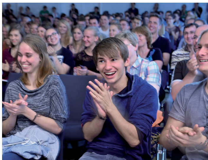
Begeisterte Schüler.