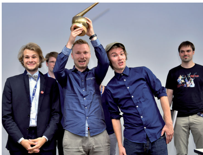
Strahlender Sieger mit goldener Retorte.

Ein Thema aus der Chemie in sieben Minuten verständlich und witzig zu erklären, ist keine einfache Aufgabe. Zumal die Themen hohe Ansprüche stellen.