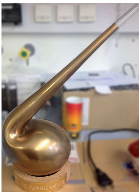
Erster Preis: goldene Retorte.